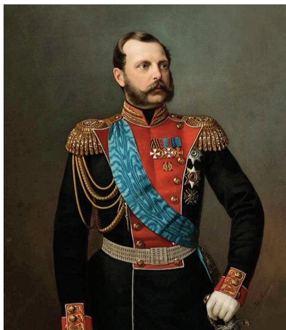
Император Александър Втори - Цар Освободител

Нито една от техните три рецепти обаче не е подходяща за случая, с който предстои да се срещнем. И все пак – като че