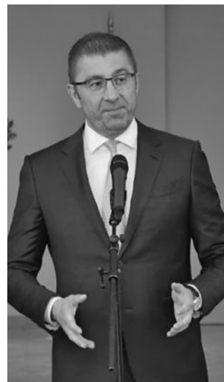
Македонският премиер Християн Мицкоски

Изминаха 24 часа от американската атака на Мицкоски, но външният министър Георг Георгиев все още не реа-