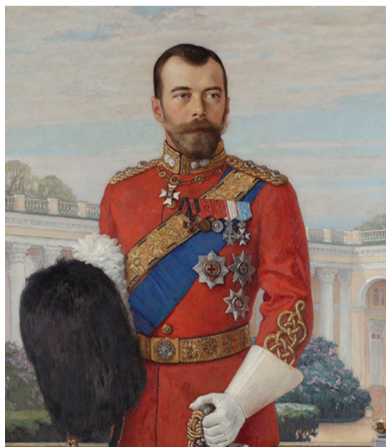
Император Николай Втори