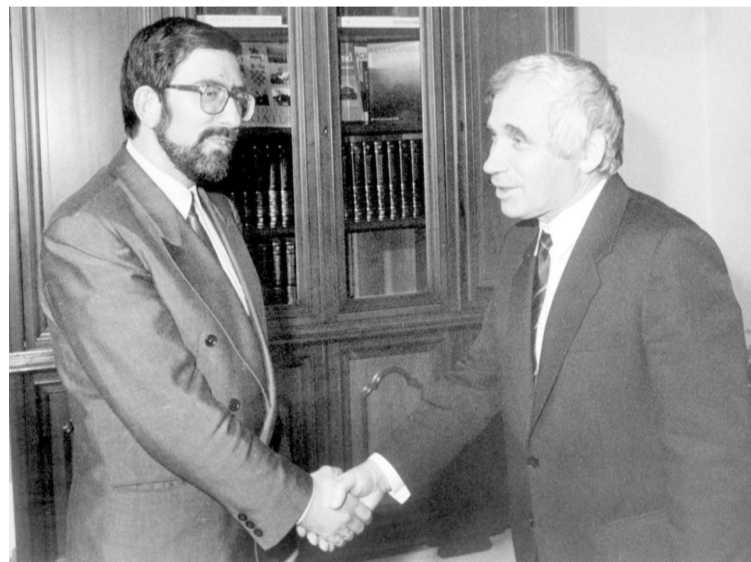
Филип Димитров и Жельо Желев, 1991 г.

на пресконференцията след президентските избори през януари 1992 г. кандидат-президентът Велко Вълканов, Пирин Воденичаров и кандидатът за вицепрезидент Румен Воденичаров. Двойката губи на втори тур с 47,15%.