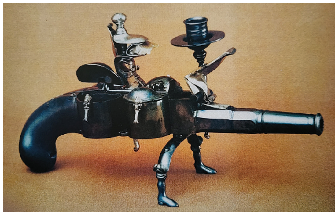
Кремъчен револвер - мастилница - свещник, Тула, Русия, 1768 г.

ни черно-бели илюстрации. Коричната цена е 55 лв. При интерес за закупуване на книгата заявки се приемат на тел. 0894 664 933 на името на автора Тодор Предев.