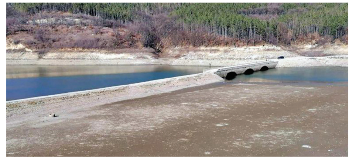
Язовир „Камчия“ достигна най-ниското си ниво през тази година

границы – когато в тях бъдат включени Херсон и Запорожие, освен Донецк и Луганск. Обективният поглед според мен е, че минималната програма, която може да доведе до реална основа за преговори, е включ-