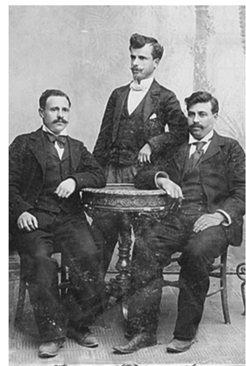
Ефрем Чучков, Климент Шапкарев и Гоце Делчев

ДО Г-н Румен Радев, президент на Република България Министерския съвет на Република България Българската академия на науките Комисията по културата и медиите при Народното събрание на Р България Министерството на отбраната на Р България Министерството на образованието и науката на Р България Министерството на културата на Р България ОТ Българската национална комисия по военна история, член на Международната комисия по военна история при ЮНЕСКО, и учените и обществените учения конференции по случай 120-годишнината от Илинденско-Преображенско-Кръстовденското въстание (27. IX.2023 г., София, Централен военен клуб)