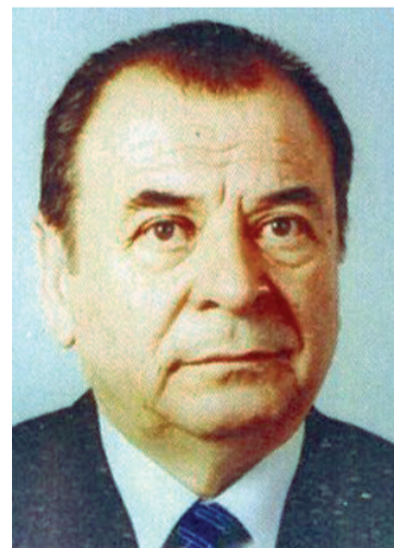
Проф. Орлин Загорев

е по-безогледна от критиката на тяхното творчество. Никога една книга не би могла да раздражни моите опоненти, както може да ги вбеси, примерно, моята позиция към техния платен космополитизъм или участието