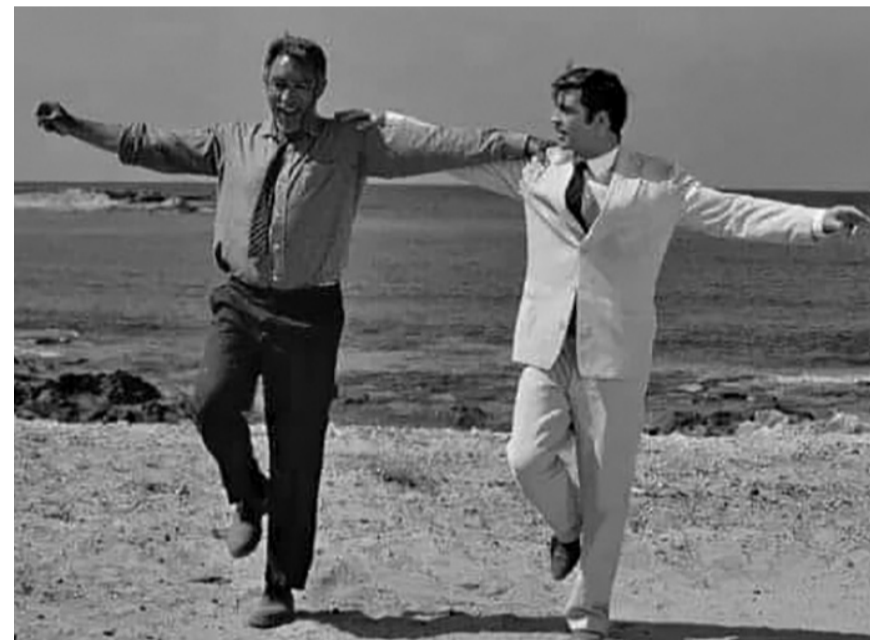
Танцът на Зорба

Така в кавги, размиски и кандърми изтече още една седмица, след която ще започне връщането на мандатите за съставяне на правителство. Пръв ще опита късмета си Борисов и ако освен подкрепата от ДПС не получи или не си напазарува подкрепа от поне още 6 депутати, щафетата ще отиде у Делян Пеевски. Но решението на безизходната може да дойде и с проста игра с кворума, при която част от депутатите да се изнизят от парламентарната зала, за да мине кабинетът на малцинството с по-малко гласове от половината плюс един от 240-членния парламент. Докато, за да мине един вот на недоверие срещу правителството, за него трябва да гласуват най-малко 121 депутати. В такъв случай одобрението на едно малцинствено правителство не изглежда мисия невъзможна. Проблемите за него ще дойдат, когато започне да предлага законопроекти, които не задоволяват част политическите джамбазии. Тогава Борисов ще усети какво значи зад гърба ти да надничат корпулентната снага на Делян Пеевски. Денков,