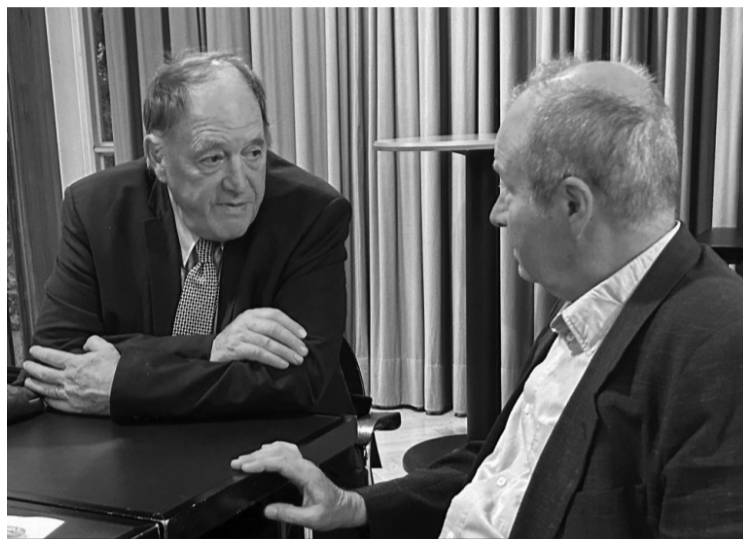
Джеймс Кенет Гелбrait (влясно) в разговор с Бойчо Дамянов.

Джеймс Кенет Гелбrait е виден американски икономист. Завършва с отличие Харвард, прави докторантура в Йейл. Настоящ е професор в Тексаския университет в Остин. Член е на изпълнителния комитет на Световната асоциация на икономистите. Син е на известния икономист и политолог Джон Кенет Гелбrait.