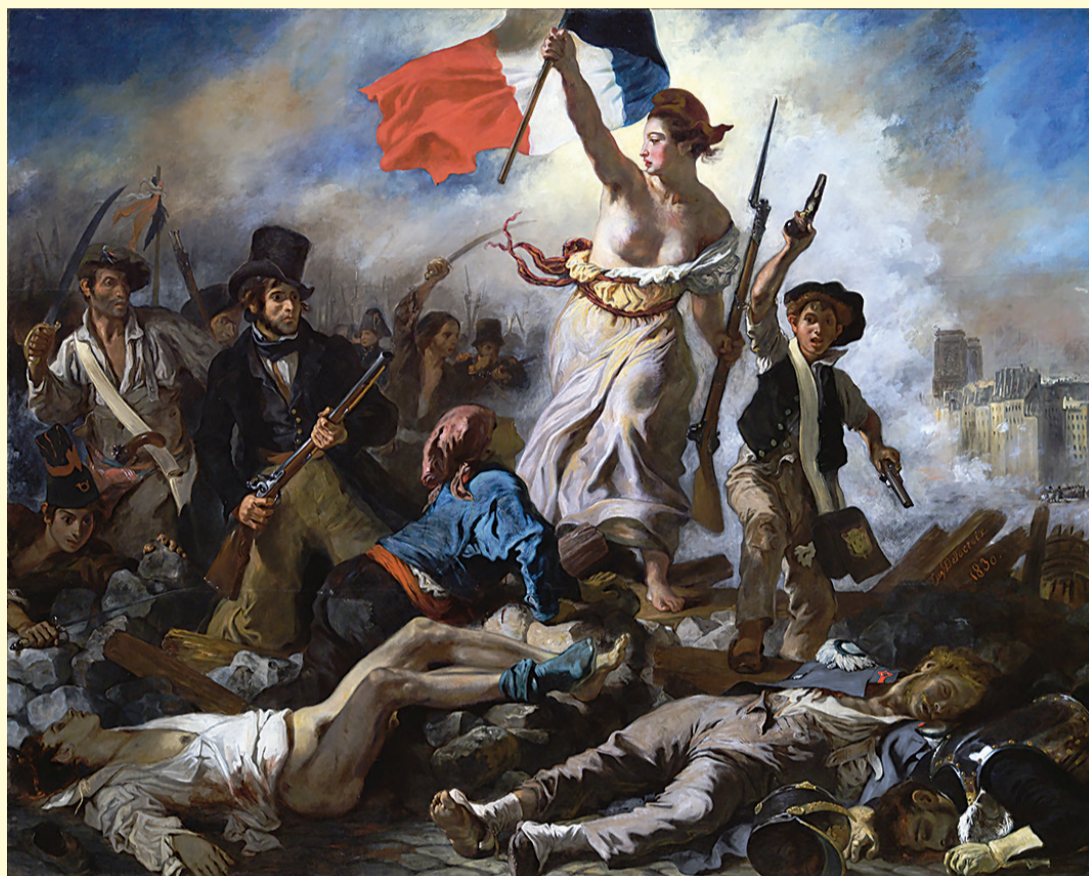
„Свободата води народа“, художник Йозен Дьолакром