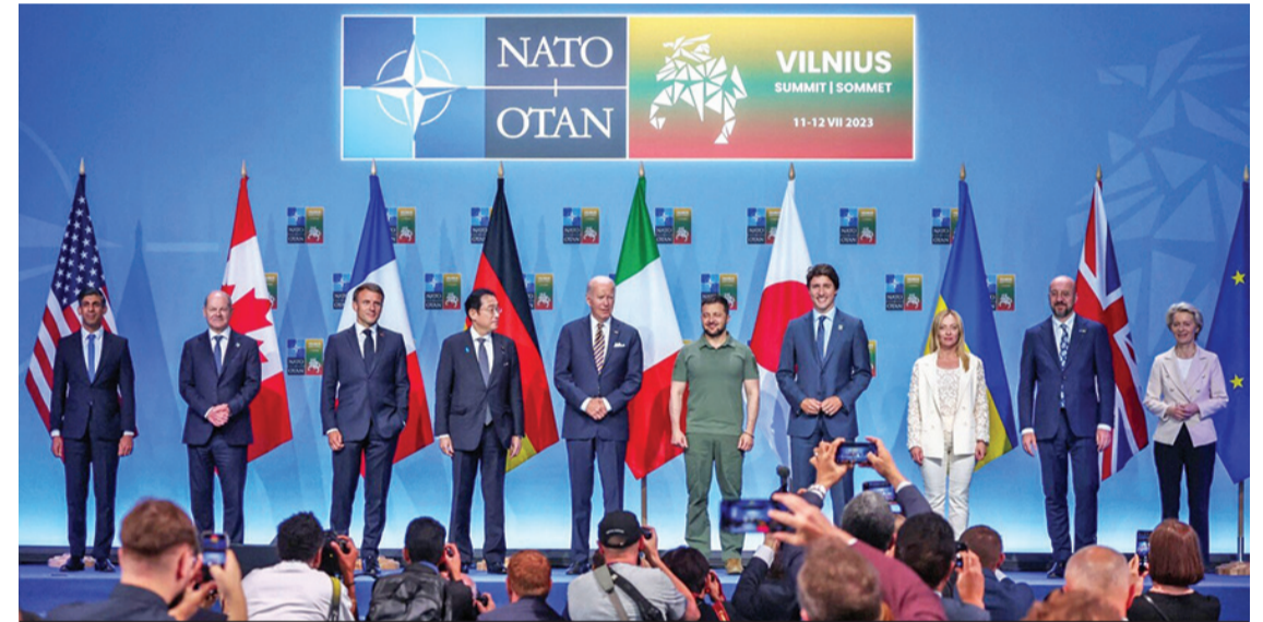
Онези, които днес печелят от отглеждането на украинския неонацизъм, като му предоставят оръжия и финансова помощ, ще трябва да отговорят за това на процеса „Нюрнберг 2“.

човеконенавистническите му възгледи. От гледна точка на логиката на историческия процес Втората световна война има кръгова композиция - „от дворец до дворец“. Бойните действия, започнали на 1 септември 1939 г., са предложани от ожесточена дипломатическа борба в европейските дворци и резиденции. В хода на различните срещи и закулисни преговори в Берхтесгаден, Фюрербай, Бад-Голдесберг, Париж всяка от страните преследва няколко цели. Наистика Германия търси реванш за наложената й унищителна парадигма на Версай-