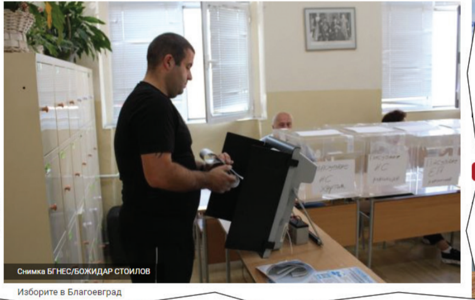
Изборите в Благоевград

Тази „незначителна новина“ обиколи всички интернет медии в деня на изборите - 9 юни.