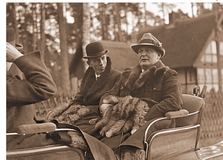
1937 г. Лорд Халифакс и Херман Гьоринг в Германия.

партньорство във военнотехническата и промишлената област засилват възможността за създаване на пакт против англосаксонците. Освен това сред управляващите кръгове в Берлин в този момент има достатъчно много привърженици на умерената линия по отношение на Съветите. Така например командващият сухопътните войски на Райхсвера