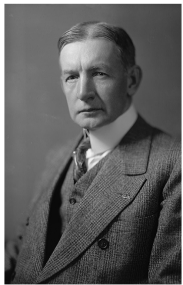
Авторът на хитроумния план Чарлс Дауес.

ровини и жизненоважни материали за нуждите на германската военна промишленост. В края на 1934 г. на Райхсбанк е отпуснат заем от 750 хил. фунта стерлинги. През декември 1934 г. след срещата на шефа на английската нефтена корпорация «Роял дъч шелл», отявления нацист Г. Детердинг с Хитлер е сключена сделка между германските промишленци и англо-американските нефтени магнати: последните предоставят на Германия нефтопродукти в размер на нейното годишно потребление за 1934 г. Доставките се осъществяват както открито, така и тайно - през Канада. Автомобилният компания «Ролс-Ройс» предава на хитлеристкото правителство, уж за търговски цели, партия нови мотори тип «Кестрел», прилагани в бойните самолети. През април 1934 г. компанията «Армс-