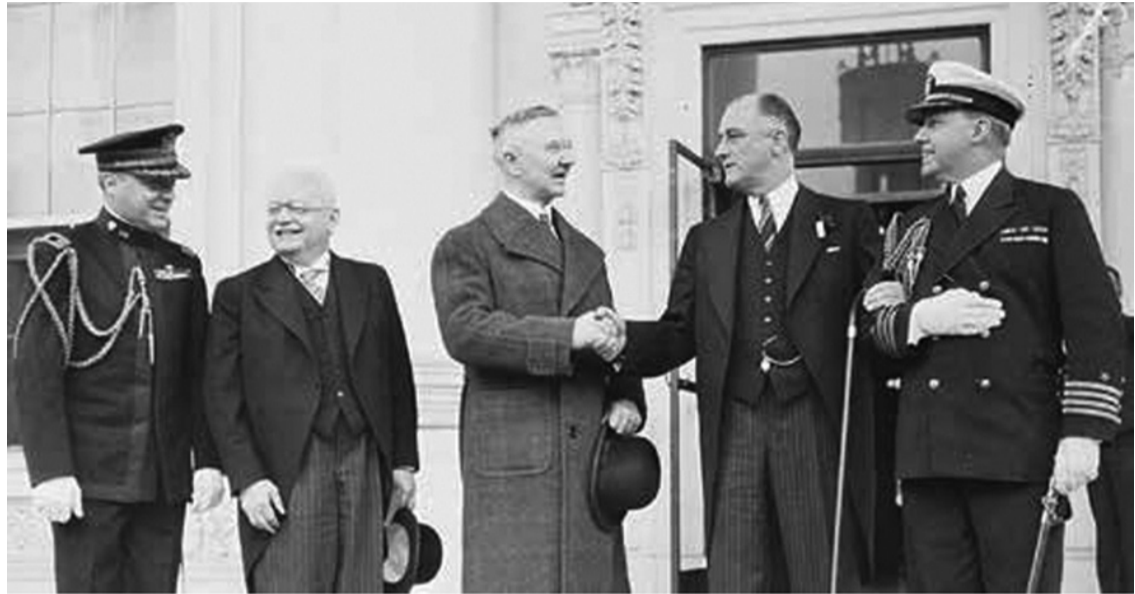
В САЩ също ценят нацистките първенци: Ялмар Шахр и Франклин Рузвелт във Вашингтон. 1930 г.

блем е насочен и към изгодното за съюзниците решение на «руския въпрос». Потокът от немски стоци на съветския пазар според замисъла на авторите на този план би бил надеждна гаранция, че СССР ще остане икономически слаба страна. Антисъветската същност на плана „Дауес“ още от