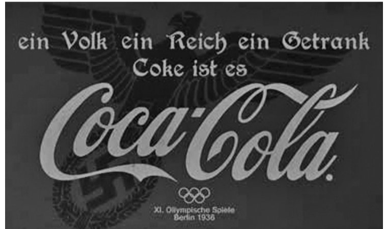
Официалният спонсор на летните Олимпийски игри през 1936 г. в Берлин: „Един народ, една държава, една напитка!“