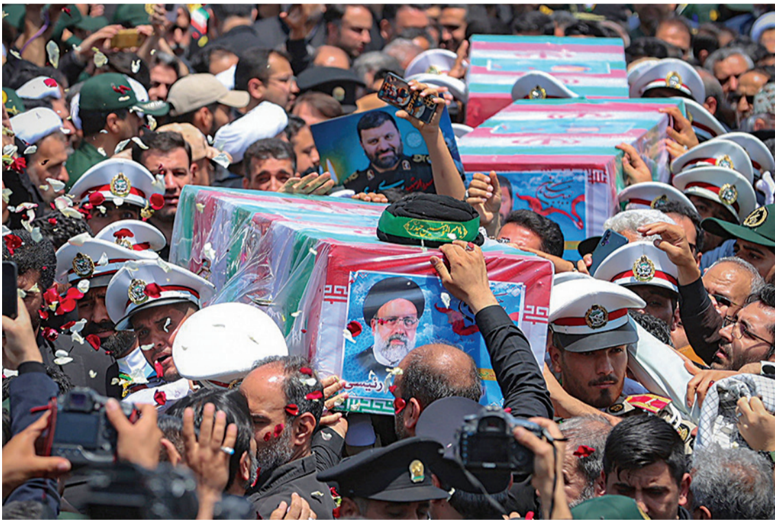
Загиналият президент на Иран Ибрахим Раиси беше погребан в свещения град Машхад.

–Да, бях преди по-малко от месец. Но не съм си говорил лич-