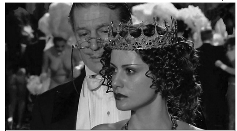
Кадрът от филма „Майстора и Маргарита“.

А после на катраненочерни коне Сатаната и свитата му, а сред тях Майсторът с Маргарита, летят към своите постоянни убе-