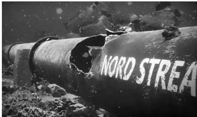
Алис Вайдел: Къде се загуби разузнаването, охраняващо удвоеното подаване на газ от Северен поток?

чат неприятни неща.“ От 2015 г. в страната бяха изнасилени 7000 жени. Насилето е насочено главно срещу жени. Да, тези хора в правителството напълно дискредитираха ситуацията с безопасността в наша-