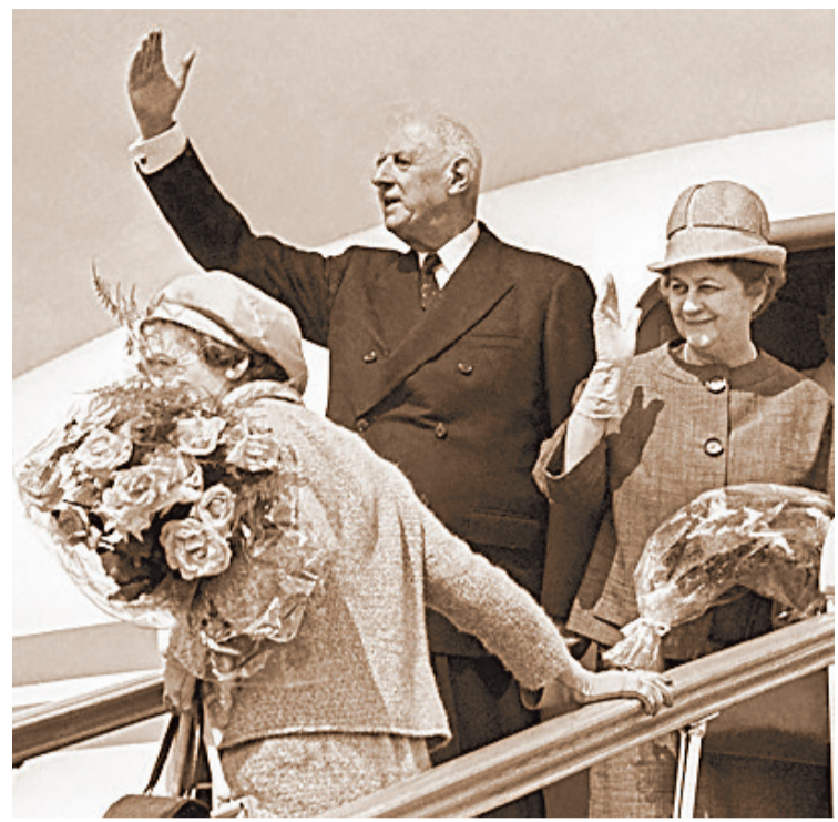
Шарл де Гол при посрещането му в Москва.

на немски капитан той повежда малка група разузнавачи и сапъори на трудна мисия: да спре влак с 500 френски деца, отправяни за Германия. Успяват да унищожат охраната на влака и да изведат всички деца в гората. Но сам той е тежко ранен и загубва съзнание. Близко денонощие лежи до железопътната линия. В джоба си имал безупречно оформени немски документи, както и снимка на жена с две светлокоси деца, на гръба на която имало надпис: „На моя скъп Хайнц от любящите го Марика и децата.“