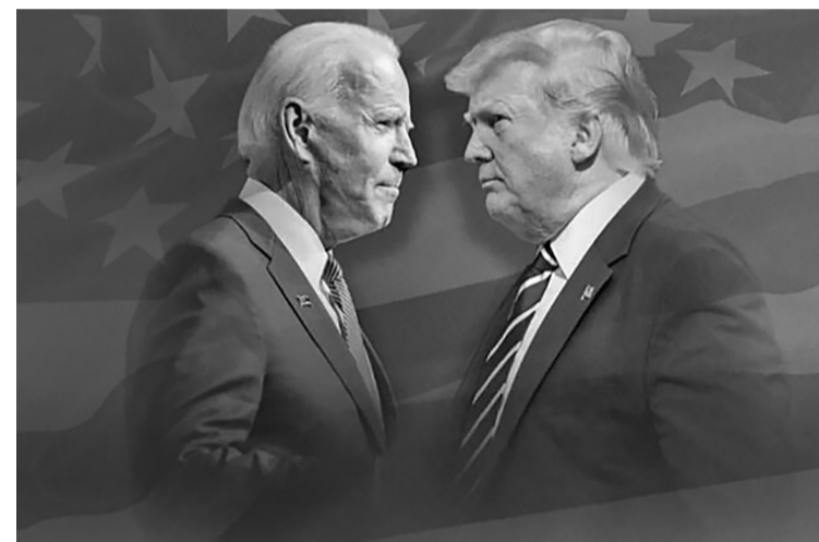
Не, няма да има промяна и разведряване след изборите в САЩ.

Също със съжаление виждам и свръхоптимизма към външни фактори, които ще