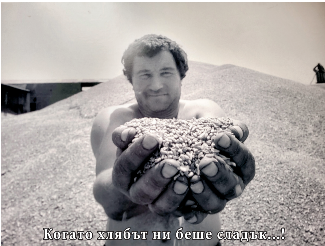
Когато хлябът ни беше сладък...!

В началото на 1990 година в общи линии схемата за разгромяване на България беше разработена. Указ 56 се подчини на пла-