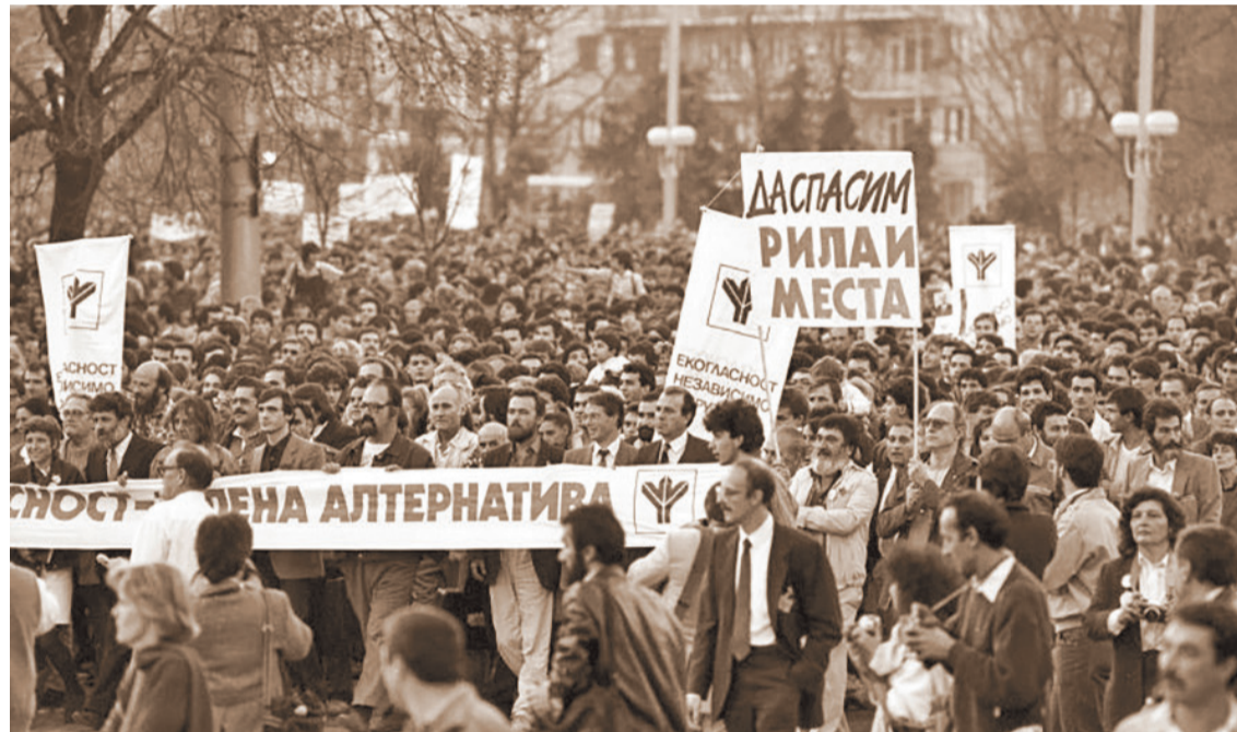
В близките дни до 10 ноември те станаха активни и непримирими, може би защото нямаша биографии на истински дисиденти и критици на режима.

Обективният поглед към миналото и особено към неговата оценка не бива да прикрива нито слабостите, нито недоволствата, още по-малко положителните му страни, усилията да се преодоляват грешките и слабостите, възстановяването на