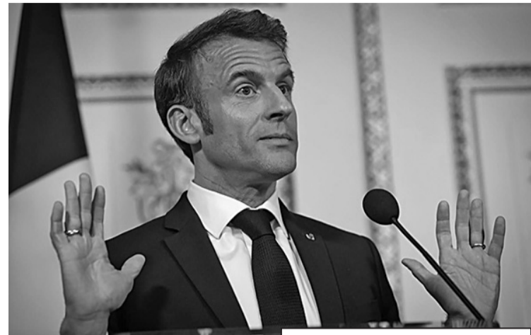
Съпругът на Брижит

Така информира своите читатели изгнаниято Politico