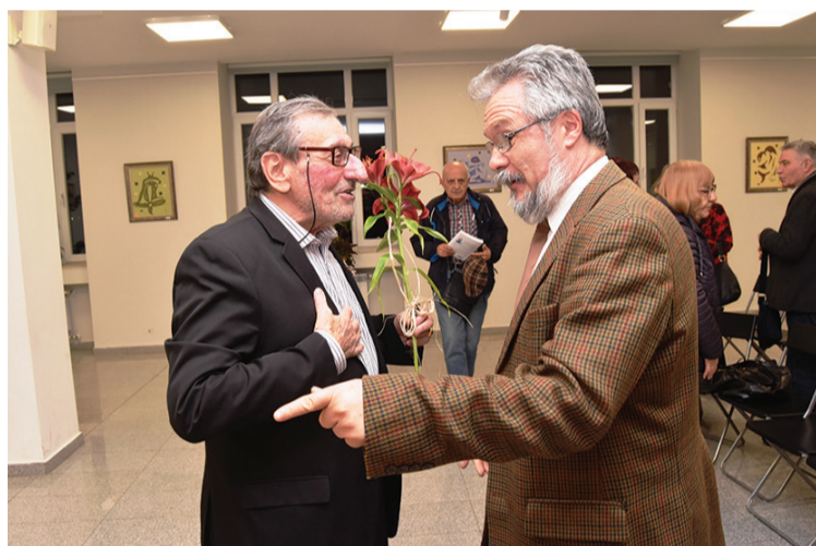
Поздравления за автора на „Унгарски дневници“ от посланика на Унгария Н. Пр. Миклош Борош.

В разгорялата се дискусия се наблегна главно върху социалните аспекти на политиката на правителството на Виктор Орбан: насърчаване на раждаемостта, чрез ефективни програми за младите семейства; лекарствата се облагат само с 5% ДДС; унгарските лекари могат да