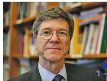
Проф. Джефри САКС

Три са основните проблеми с ЦРУ: неговите цели, методи и безотчетност. Неговите оперативни цели са това, което ЦРУ или президентът на Съединените щати определят като интерес на САЩ в даден момент независимо от международното или американското право.