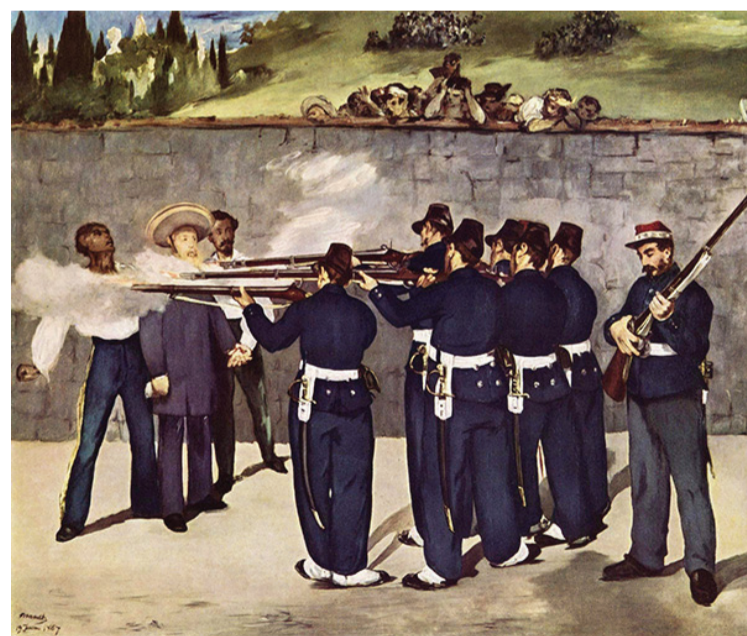
Екзекуцията на Император Максимилиан 1868

чудото (Enfant du Miracle), което би трябвало да царува под името Анри V, никога не става крал. Нереализираният Анри V,