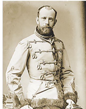
Рудолф фон Хабсбург, кронпринц на Австро-Унгария.