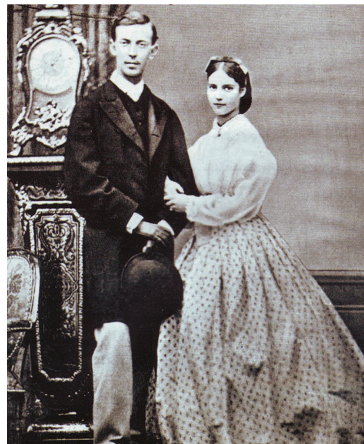
Цесаревич Николай Александрович и неговата годеница Дагмар Датска.