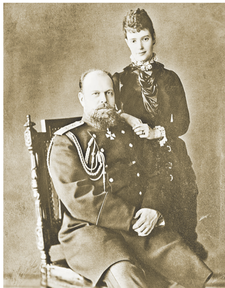
Император Александър III и Мария Фьодоровна (Дагмар).