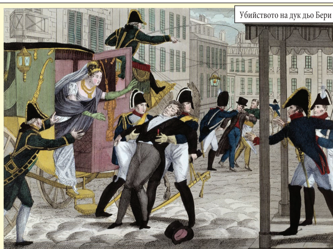
Убийството на дук дьо Бери

И ван Кръстев, вече почти забравен, напомни за себе си с шокиращото за главен соросид като него изявление, че: „Съотношението на силите се променя. И ние - Западът, САЩ, Европа - не сме от страната на печелившите“ , изложено в интервю за германски вестник. Както се сторило на Петьо Блъсков, „Иванчо е обърнал палачинката“ ... Не мисля, че е така. Синът на бившия зам. зав. отдел в ЦК на БКП е с твърде висока позиция в Дъл-