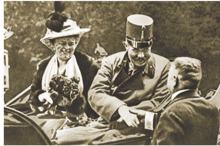
Ерцхерцог Франц-Фердинанд в Сараево, минути преди атентата