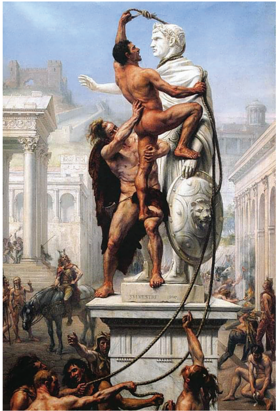
„Разграбването на Рим от вестготите“ - 1410 г., худ. Жозев Ноел Силвестър