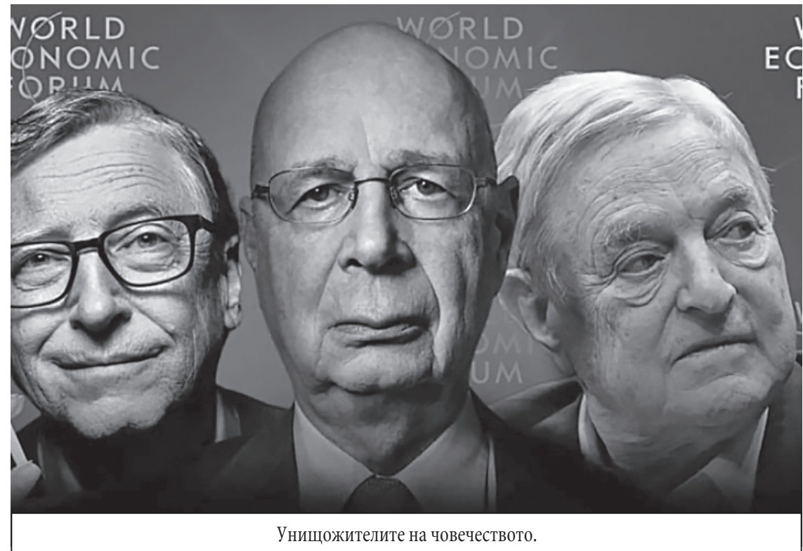
Унищожителите на човечеството.

се съпротивлява, така или иначе, буржоазията е силна, те ще спечелят...“ Е, първо, не е факт, че те ще спечелят. Второ, срамно е да не се съпротивляваш. Но има и още нещо, което е доста прагматично. Историята показва, че точно това се случва в живота. Факт е, че никоя нова социална система не печели с нокаут. Винаги е с компромис. И колкото повече зъби един млад хищник извади в съпротивата на различни нива, толкова