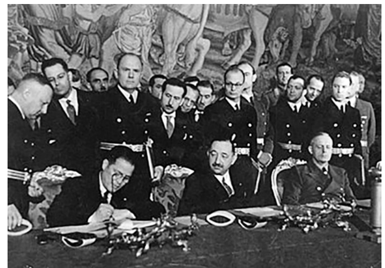
На 1 март 1941 г. премиерът Богдан Филлов (с мустаците) подписва в двореца Белведере във Вiena присъединяването на страната ни към Трестранния пакт

Първоначалното съзнание, че като патриот е длъжен да помогне на отечеството, се заменя с увереността, че в своето политическо израстване е натрупал достатъчно опит и държавническо умение и е готов да поеме тежката участ