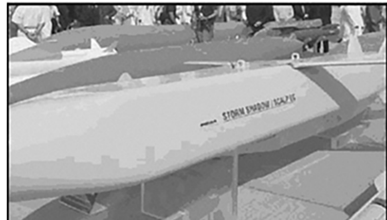
Москва предупреди, че появата на снаряди с обеднен уран и на английските ракети Storm Shadow в Украйна ще има сериозни последици.

Русия в Украйна. Всеки военен анализатор знае, че при сегашното състояние на нещата Украйна просто не може да надделее над Русия. Илюзията на НАТО за „замразен конфликт“, който изглежда задвижват тяхното безумно желание да въоръжават Украйна до безкрайност, са водени от фундаментално погрешни оценки по отношение на руския икономически и военен капацитет, и волята на руския народ да поддържат този конфликт.